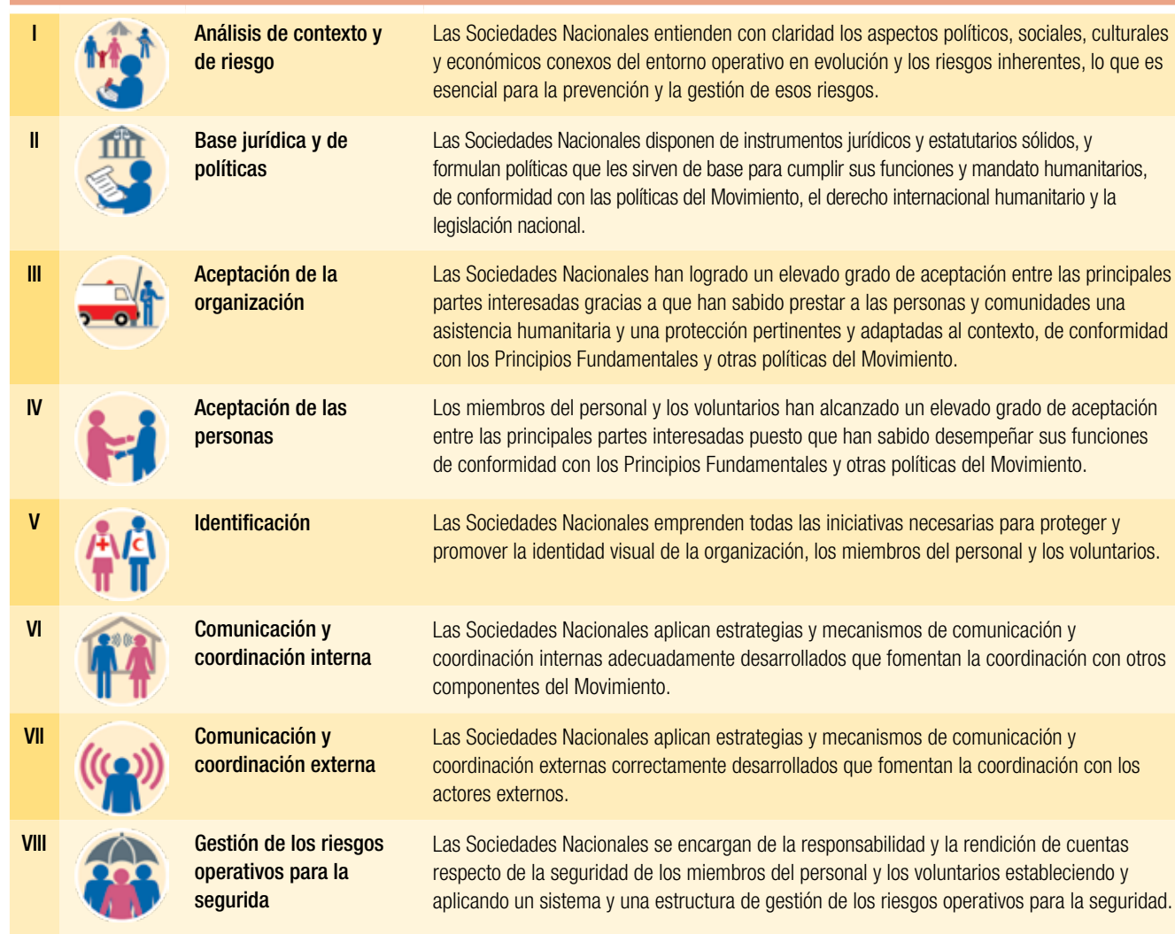
FIGURA 1: LOS OCHO ELEMENTOS DEL MARCO PARA UN ACCESO MÁS SEGURO

Habida cuenta de la vinculación entre los dos proyectos y la amplia experiencia de la CRL en materia de aplicación de los Principios Fundamentales para fortalecer la aceptación, la Cruz Roja Británica y el CICR colaboraron en la tarea de identificar las lecciones que se desprenden de la modalidad de trabajo de la CRL. Los objetivos del presente estudio de caso son, por consiguiente: