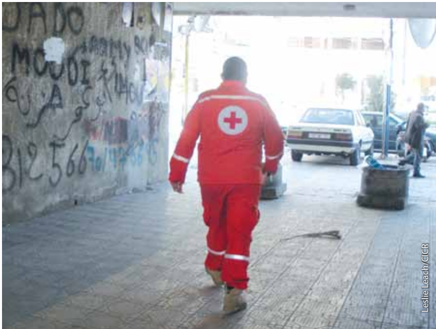
Un voluntario de los SMU se dispone a partir en misión, en Trípoli.