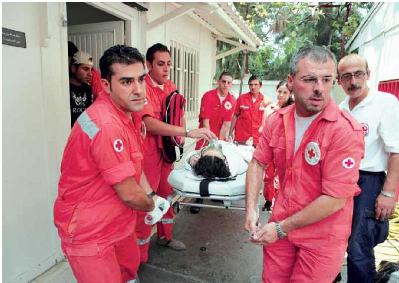
Socorristas de la Cruz Roja Libanesa trasladan a una joven al hospital.

Con 45 puestos de ambulancias en todo el país y con el apoyo de unos 2.700 socorristas y 270 ambulancias, la intención de la CRL es responder al 80 por ciento de las llamadas de emergencia en un plazo de nueve minutos. Los SMU se enfrentan con algunos problemas importantes, entre ellos el de prestar un servicio de emergencia nacional de 24 horas al día operado casi exclusivamente por voluntarios y con bajo presupuesto; pero, el profesionalismo de los motivados voluntarios de la CRL se traduce en la prestación de servicios humanitarios de emergencia eficaces, fiables y pertinentes para las comunidades de todo Líbano.