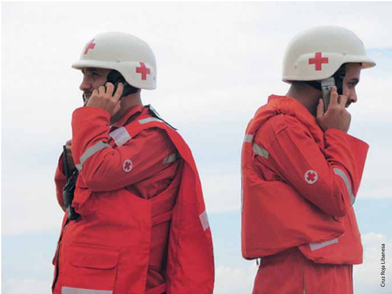
Voluntarios de los servicios médicos de urgencia de la Cruz Roja Libanesa preparándose para entrar en acción