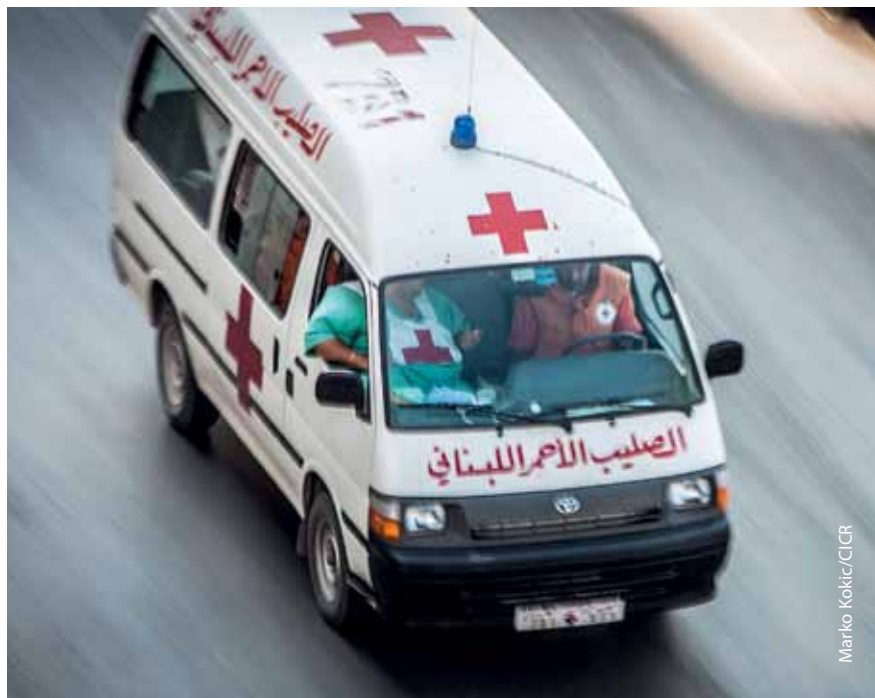
Ambulancia de la Cruz Roja Libanesa.

El amplio conocimiento del emblema de la cruz roja en Líbano y la escasa oposición al uso de la cruz roja en lugar de la media luna roja en una sociedad que, en opinión de algunos, está conformada en un 60 por ciento por musulmanes, son testimonio de la sólida reputación del Movimiento Internacional de la Cruz Roja y de la Media Luna Roja, y de la CRL en particular.