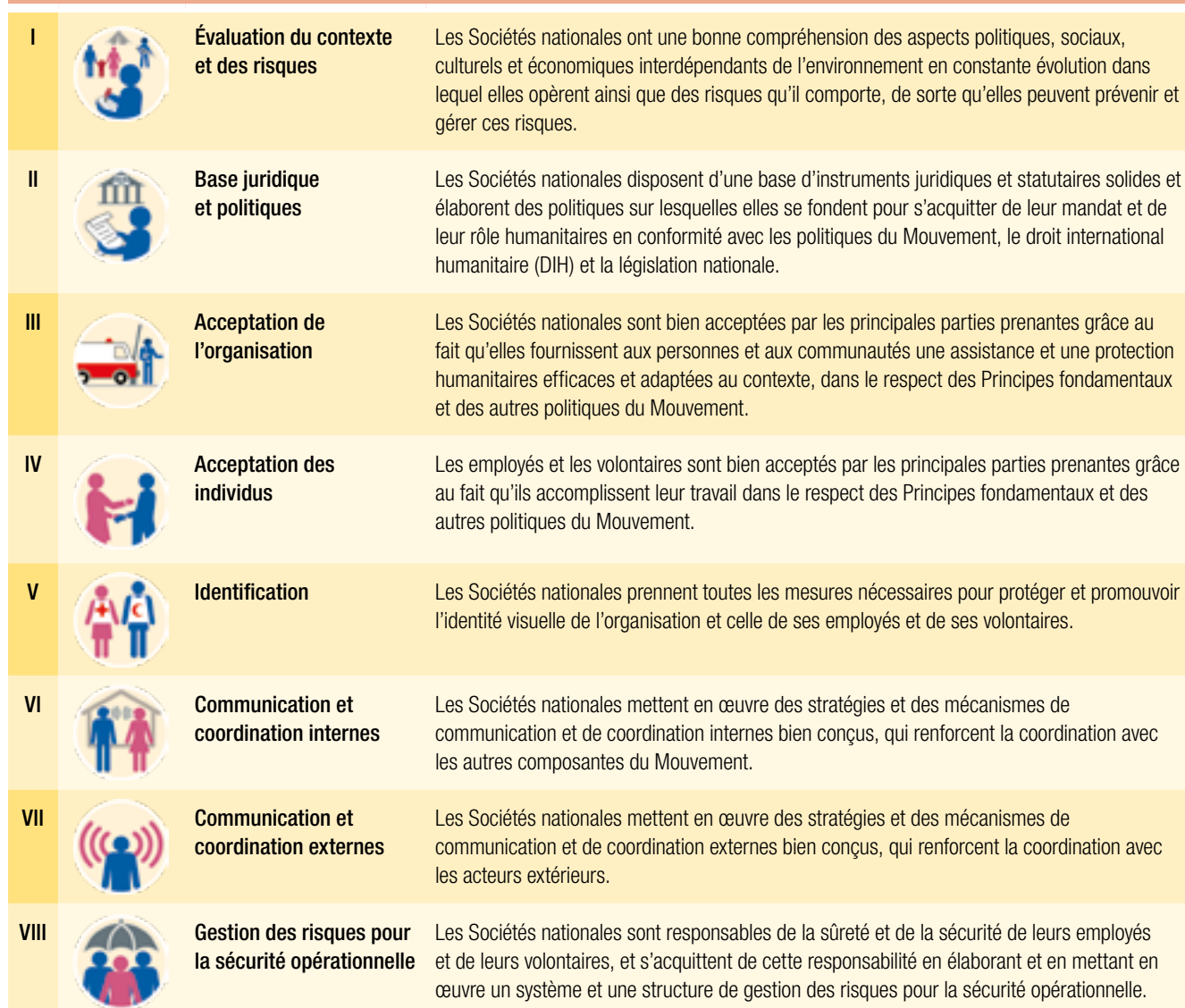
FIGURE 2 : LES HUIT ÉLÉMENTS DU CADRE POUR UN ACCÈS PLUS SÛR