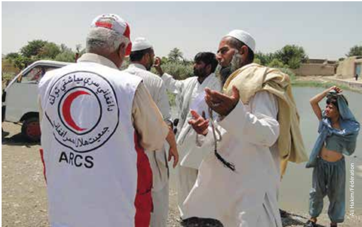
Des collaborateurs du Croissant-Rouge afghan parlent avec des membres d'une communauté.