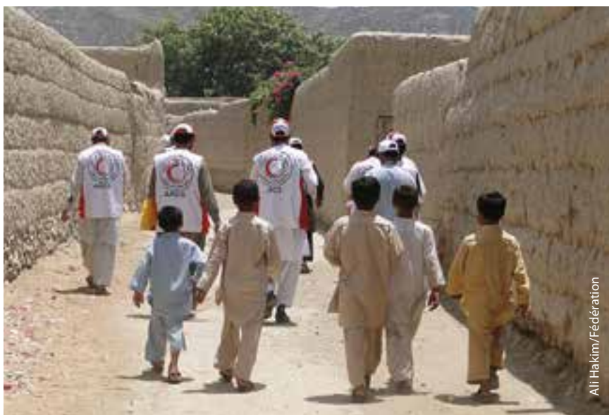
Une équipe du Croissant-Rouge afghan visite le village de Hazar Naw pour réaliser une évaluation des besoins.

Le Croissant-Rouge afghan a jugé indispensable d'adopter une stratégie de préparation et d'intervention en cas de conflit pour améliorer la sécurité d'accès du Mouvement au plus grand nombre possible de personnes touchées par le conflit. Le CICR, la Fédération internationale des Sociétés de la Croix-Rouge et du Croissant-Rouge et les Sociétés nationales partenaires dépendent du vaste réseau de volontaires de la Société nationale, actifs dans toutes les provinces. Au fil du temps, le Croissant-Rouge afghan a modifié progressivement et de façon ad hoc son approche de l'amélioration de la sécurité d'accès aux personnes et