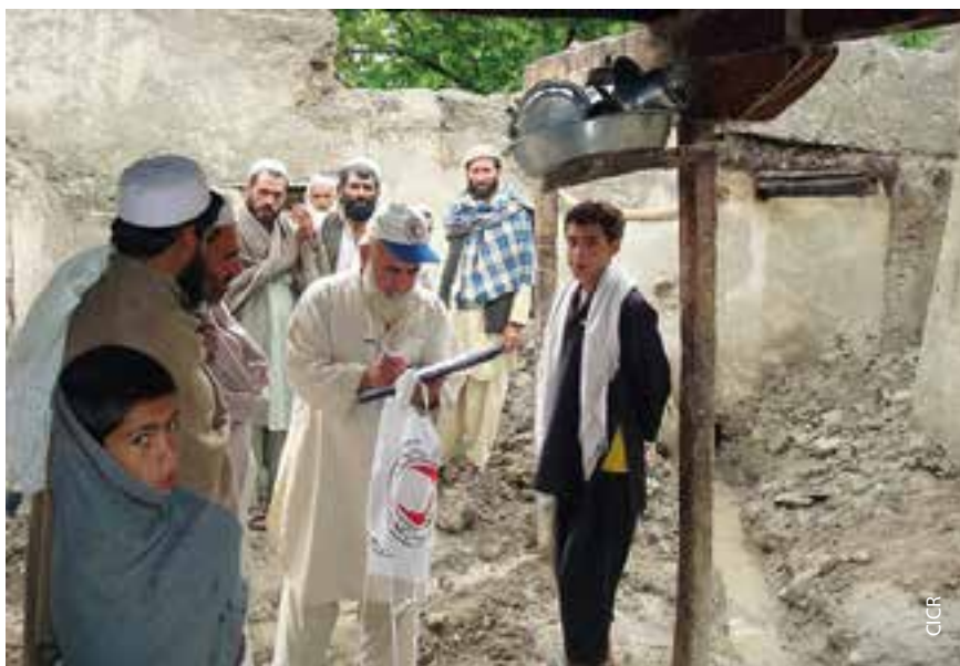
Sondage du Croissant-Rouge afghan à Shiraz.