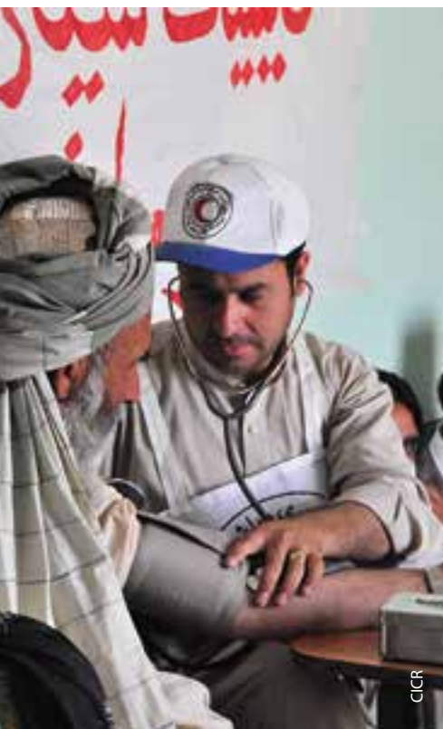
Lors d'une mission dans la province de Samangan, le Croissant-Rouge afghan installe une unité mobile de santé pour fournir des services à la communauté.

Les chefs des sections entretiennent des relations suivies avec leurs volontaires dans les communautés afin de pouvoir analyser les détails du contexte, notamment sur la base d'informations sur un conflit en cours et/ou des violences, les groupes armés présents dans la zone, les risques, et les besoins de la communauté. Les informations ainsi recueillies alimentent le processus d'évaluation de la Société nationale, favorisent l'élaboration de stratégies d'intervention pertinentes et contribuent à l'analyse contextuelle du Mouvement dans son ensemble.