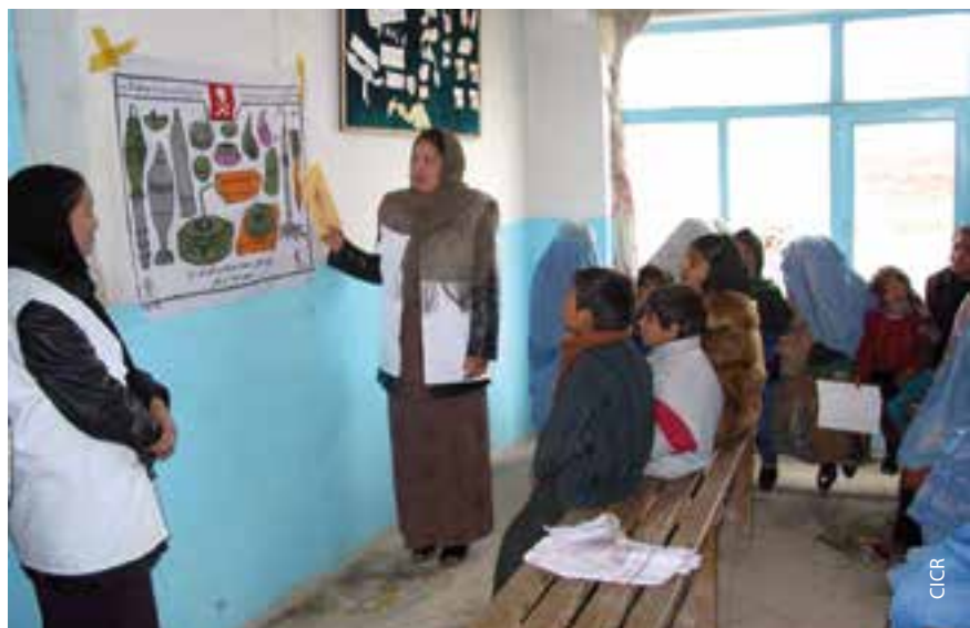
Des femmes et des enfants participent à une séance de sensibilisation au danger des mines.

La présidente du Croissant-Rouge afghan préside le comité d'intervention en cas de catastrophe au siège et, avec son équipe dirigeante, fournit des