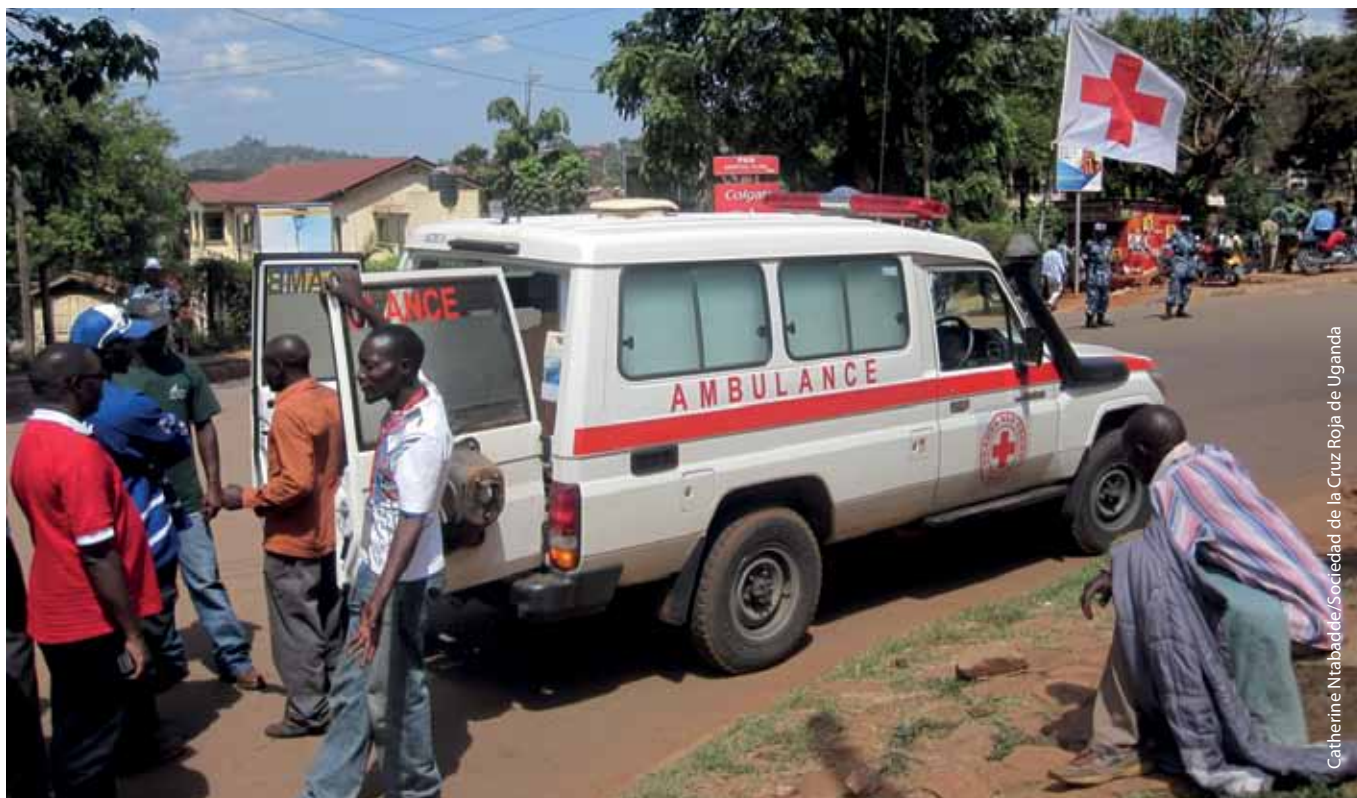
La Cruz Roja de Uganda impartió primeros auxilios y proporcionó servicios de ambulancias durante los disturbios originados en el marco de la campaña "Caminar al trabajo" organizada por activistas luego de las elecciones generales en 2011.

Nuestra función consistió en administrar primeros auxilios a los heridos por la violencia y, cuando fue necesario, en evacuarlos en ambulancia.